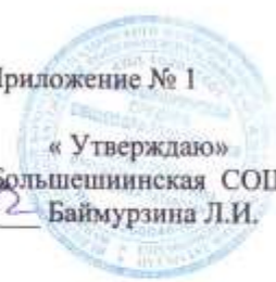
Схема оповещения при чрезвычайных ситуациях МБОУ « Большешинская СОШ»